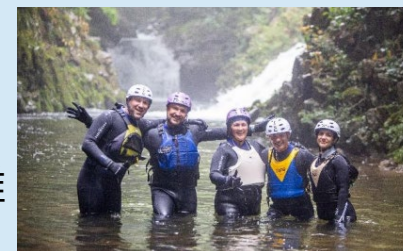
シャワークライミングの様子

アドベンチャーツーリズムや温泉街再生を基盤に雇用が増え、これからを担う人材が定住、Uターンも含めた子育て世代が増え、観光客増により交通アクセスも維持され、地域住民が地域の未来に自信を持ち、持続可能な地域・社会になる