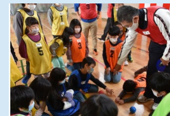
リフレッシュプログラムの様子