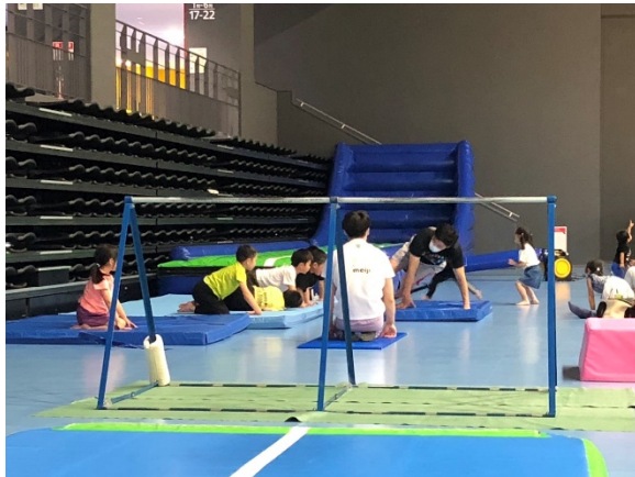
子ども体操教室 (2020年6月、帯広市)