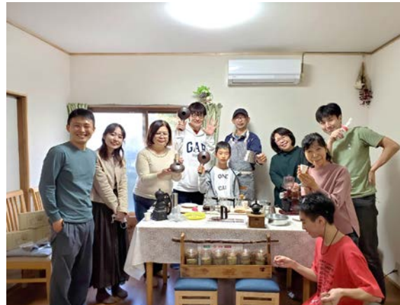
「くるみのおうち」で 開催された珈琲焙煎講座 (2020年10月23日、川崎市)