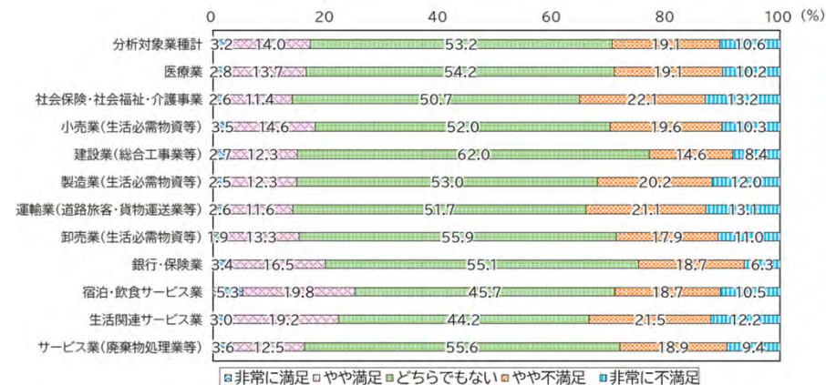
新型コロナウイルス感染症の感染拡大前の平時の賃金の満足度

(注) 「あなたの仕事に対する給与（時間外手当等を含む）及び給与への満足度はどの程度でしたか」と尋ねたもの。