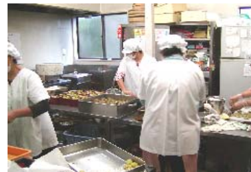
地場農産物を 加工する施設の整備