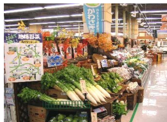
量販店における インショップの設置