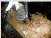
水道管の地震被害例