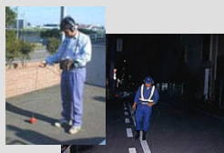
漏水調査の様子(イメージ)