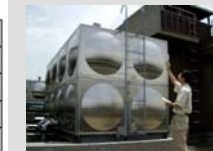
貯水槽の点検(イメージ)