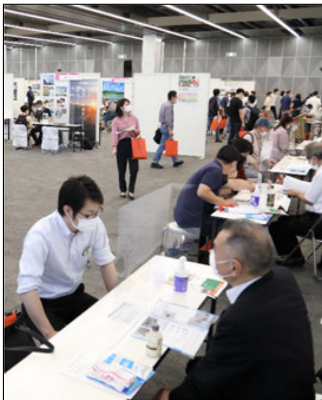
(7月26日東京会場の様子)