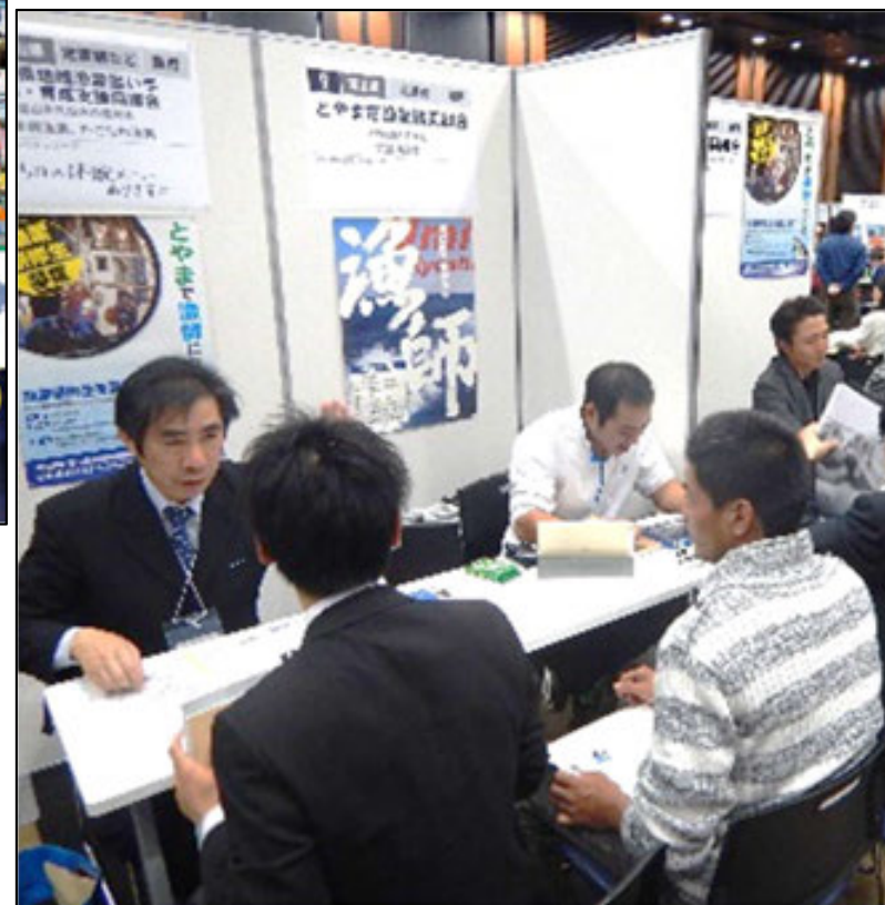
(過去のフェアの様子)