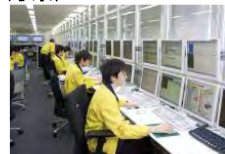
nTOC (ネットワーク監視センター)