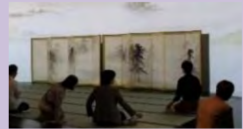
びょうぶとあそぶ会場