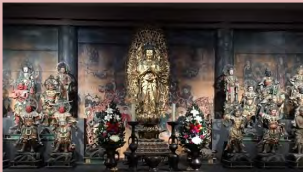
仁和寺観音堂内再現

僧侶の修行道場のため、一般には非公開の仁和寺観音堂を展示室に再現。実際に安置されている仏像33体に加え、壁画を高精細画像で再現し観音堂内部の特別な空間を体感。