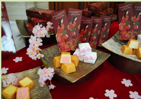
資生堂パーラーとのコラボ商品