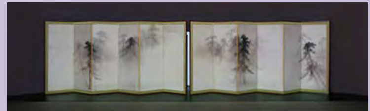
「松林図屏風」(綴プロジェクトによる高精細複製品)