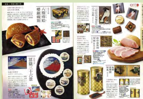
三越伊勢丹との中元・歳暮コラボ商品