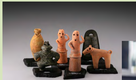
海洋堂と開発した考古学フィギュア