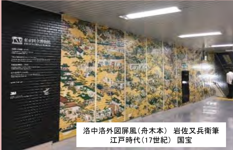
洛中洛外図屏風(舟木本) 岩佐又兵衛筆 江戸時代(17世紀) 国宝

東京国立博物館の所蔵品のデータを提供・監修し、3Mの技術でフロア・路面用フィルムを作成。 成田国際空港の各所に設置し、外国人観光客を日本古美術の魅力的な作品で歓迎。(～2018. 3)