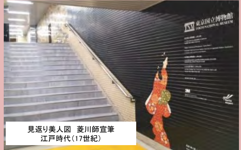
見返り美人図 菱川師宣筆 江戸時代(17世紀)