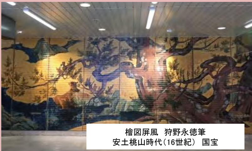
檜図屏風 狩野永徳筆 安土桃山時代(16世紀) 国宝