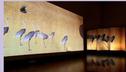
光のマジックによる金屏風の表現

高さ約5m、直径約15mの半円形の大型スクリーンの映像と、国宝「松林図屏風」の高精細複製画により、松林の風と匂いをリアルに体感し、畳に座ってみるという、屏風本来の鑑賞スタイルで長谷川等伯の描いた世界を堪能するキヤノンと共同で実施した企画。 入場者数 82,115人