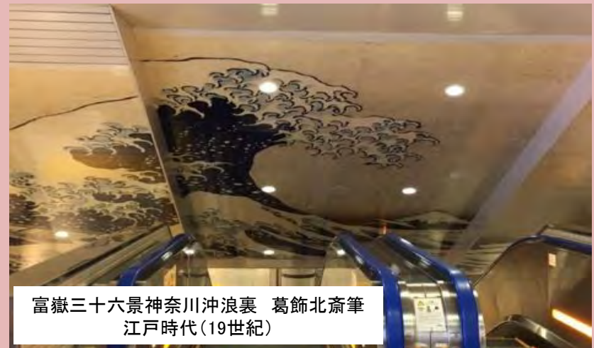
富嶽三十六景神奈川沖浪裏 葛飾北斎筆 江戸時代(19世紀)