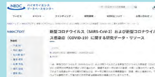
※3月～現在のビュー数は2万件超