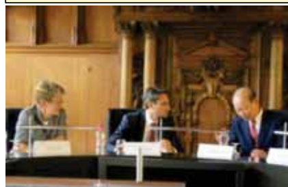
H29.8.9 バーゼル両州政府知事等との懇談

アルミ関連企業、大学、公設試等による研究開発プロジェクトやインターンシップ受入れを支援