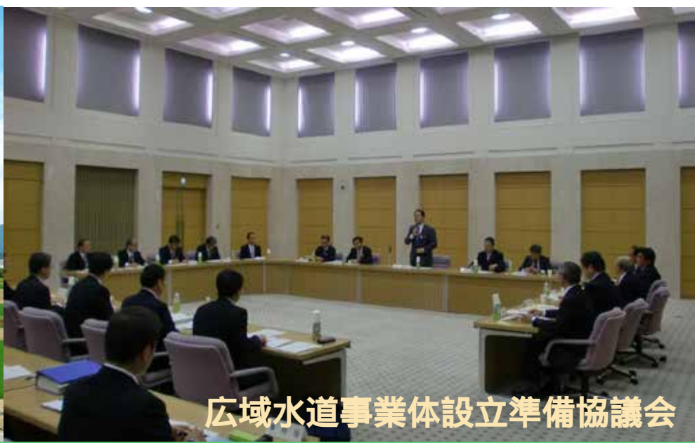
広域水道事業体設立準備協議会