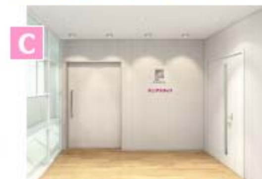
清潔感が感じられる白と木目を基調としたエントランス