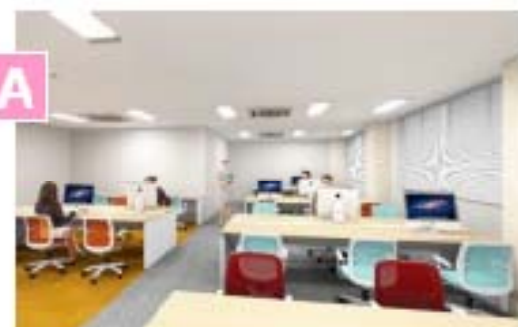
軽快でカラフルなメッシュチェアを採用。オフィスの空間を明るく彩ります。