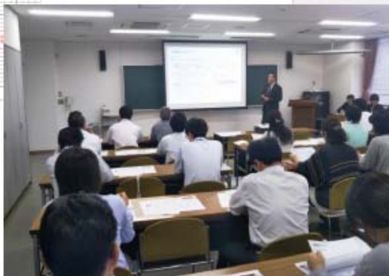
調査開始前の職員向け説明会