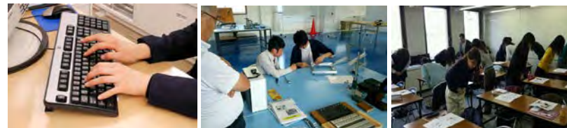
オリジナル eラーニングコース