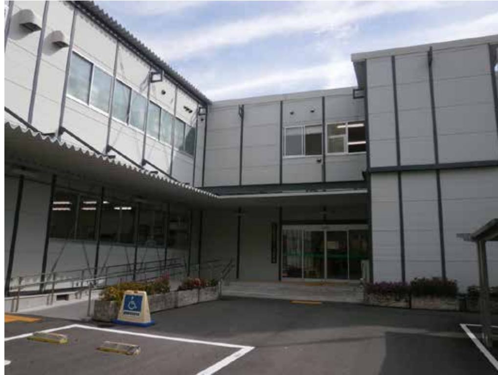
高知市役所中央窓口センター