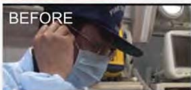
救急病院に電話をかけ続ける