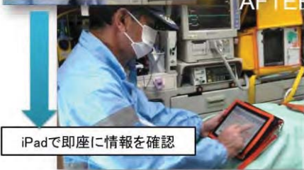
iPadで即座に情報を確認