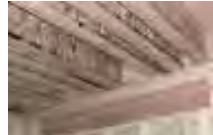
事業における山梨県産材の採用