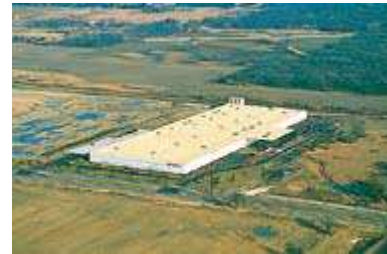
ウィスコンシン工場