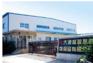
アイリスペットフード