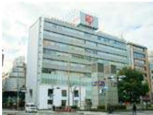
アイリス心斎橋ビル