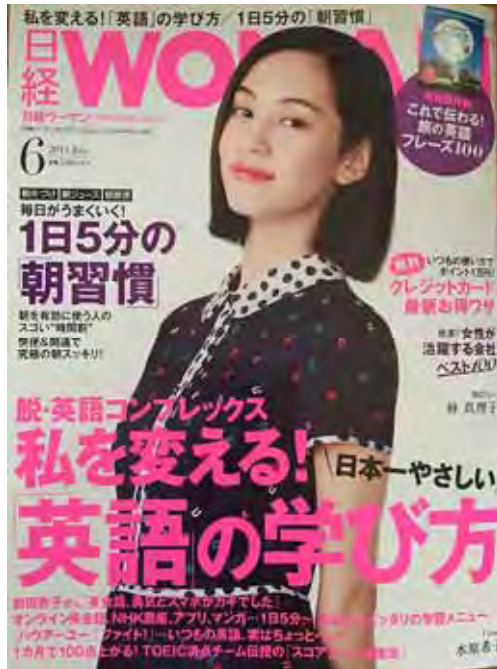
女性が活躍する会社ベスト100 日経ウーマン2015年6月号