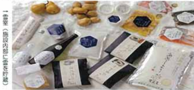
雪室 (施設内部に雪を貯蔵)