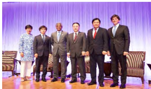
在日米国商工会議所(ACCI) イベントの様子(27年6月)