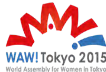
政府主催 女性が輝く社会に向けた 国際シンポジウム(27年8月)