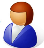
官民人材交流センター担当者

お問合せありがとうございます。求人・求職者情報提供事業という制度があります。ホームページの利用申込みフォームから新規登録手続きをお願いいたします。