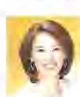
評議員 有森 裕子

これからの社会は、Young supporting oldから、All supporting allに変えていく必要があります。休眠預金の活用も、まさにこの理念に沿ったもの。知恵を出し合って、みんなで弱者を支える新しい社会を創っていきましょう。