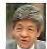
評議員 田原 総一郎

みらい財団の最大の特徴は、社会イノベーションを実際に生み出したことがある社会のリーダーが結集していること。社会イノベーションの可能性と困難の両方を熟知しているリーダーたちだからこそ、本物の社会起業家を発掘し、厳しく暖かく支援し、インパクトを担保することができるのだ。