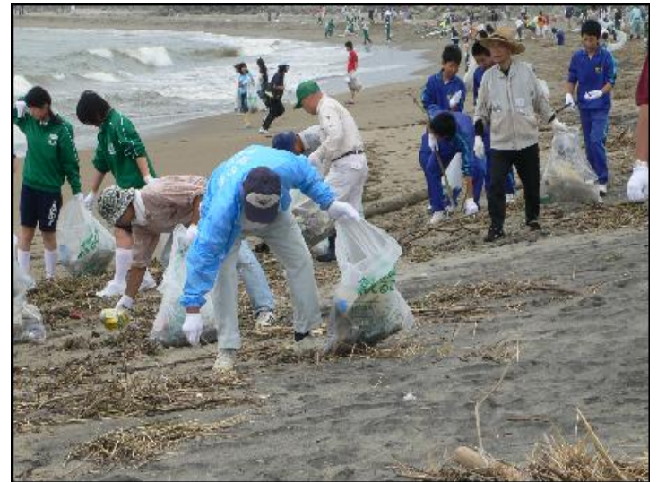
NPO等による海岸清掃