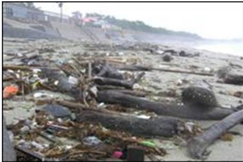
海岸漂着ゴミや流木等の状況

全国的な問題となっている海岸の漂着ごみ・流木対策を推進するとともに、地域の活性化、雇用創出を図るため、海岸漂着ごみの除去・処分及び漂着状況のモニタリング・状況調査により、海岸の環境の保全・改善、海岸保全施設の機能維持を図るとともに、地域の雇用を図る。