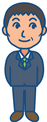
B氏・ビル管理会社勤務 (エネルギー管理士)