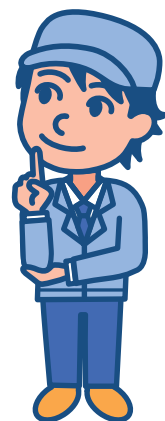
A氏・自営業 (省エネルギー普及指導員)

ISO15001や14064-1の講義について、ISO9000・14001・27001・20000を自社で実践してきたので、今回の講義で環境マネジメントシステムの違いが良く理解できました。特に、推進組織体制の動き等がとても参考になりました。また、試行的排出量取引制度の講義では、クレジットの生み出し方や課題が見えてきてかなり有意義でした。