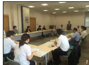
石井町農業振興協議会