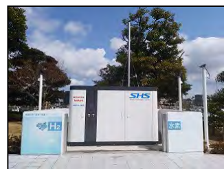
水素ステーション(イメージ)