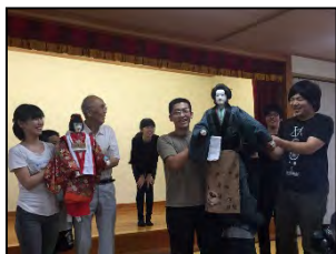
人形浄瑠璃ワークショップ