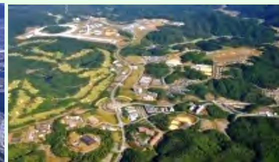
【播磨科学公園都市】

連携市町におけるものづくり産業の集積状況等を調査・分析し、各市町が持つ企業立地環境の強みを的確に把握するとともに、広域企業立地ガイド等の新たなPRツールを作成し発信する。