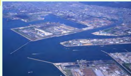
【臨海部に集積する企業群】

ものづくりの一大拠点である播磨圏域全体で、兵庫県と協力しながら企業立地に関する播磨圏域の優位性をアピールするなど、圏域全体で企業誘致に取り組むことにより、 圏域全体の産業振興や雇用の創出 を図る。