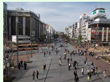
【姫路駅北駅前周辺】