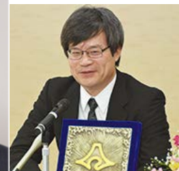
ノーベル賞 天野 浩