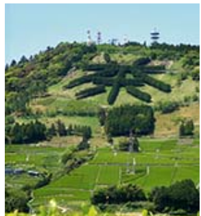
世界農業遺産 茶草場農法