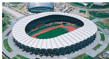
ワールドカップ会場 エコパスタジアム