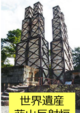
世界遺産 叡山反射炉