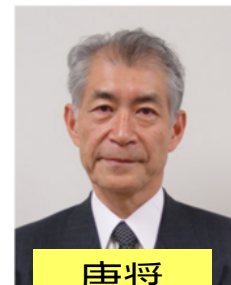
唐奨 本庶 佑