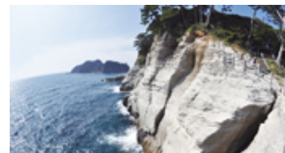
世界ジオパーク申請中 伊豆半島