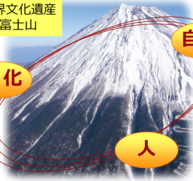
世界文化遺産 富士山