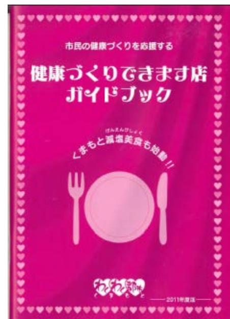
健康づくりできます店ガイドブック