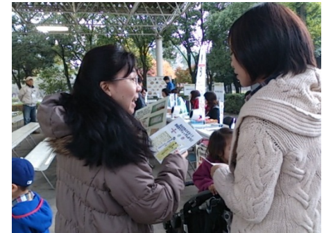
糖尿病学会イベント