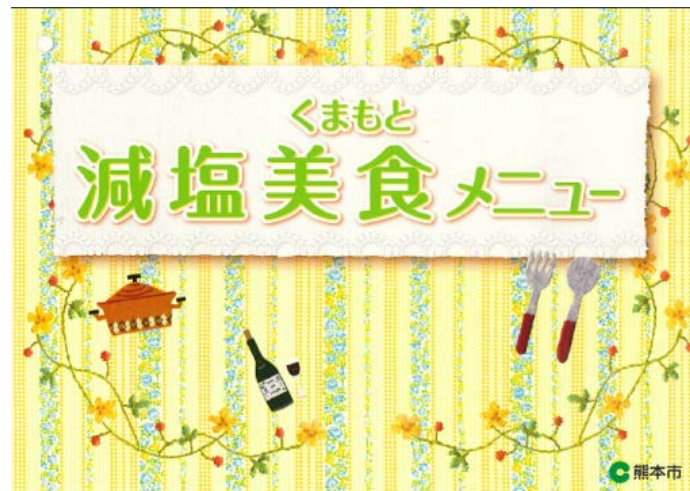
くまもと減塩美食メニュー