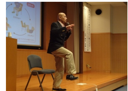
気づける・学べる・楽しめる健康講座