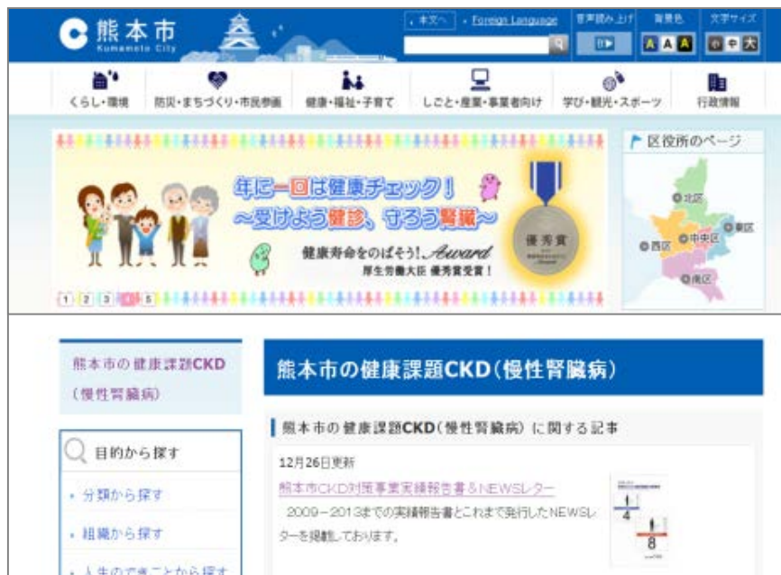
CKD啓発ホームページ