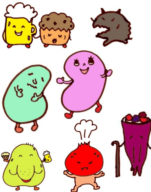
生活習慣病キャラクター