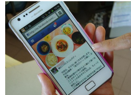
食事・運動支援コンテンツ