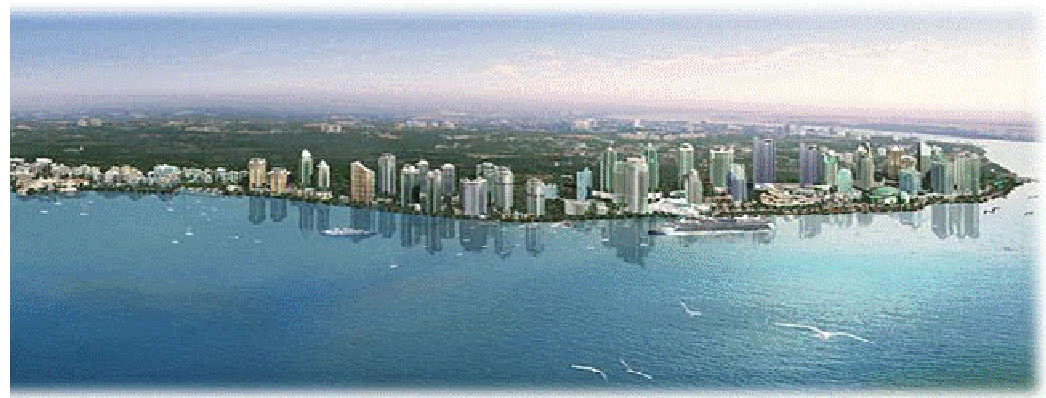
Tropicana Danga Bay