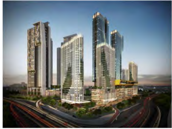
Tropicana City Centre