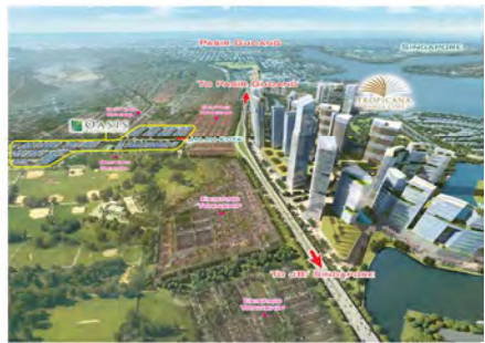
Tropicana Danga Cove