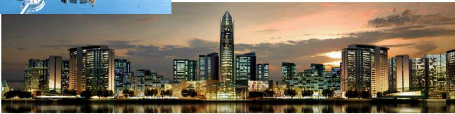
Penang World City