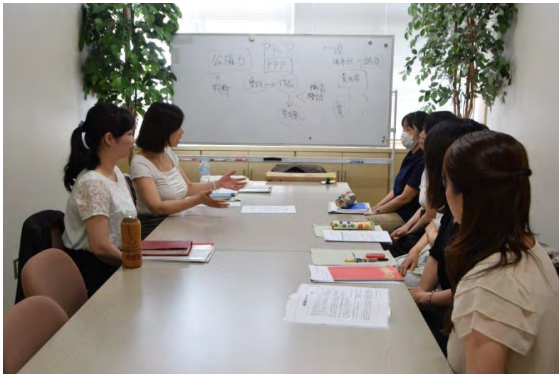
委託前の研修風景