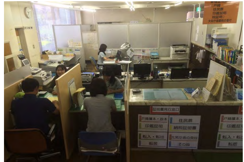
委託後の総合窓口