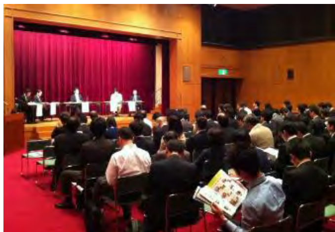
事業承継シンポジウム（平成25年）