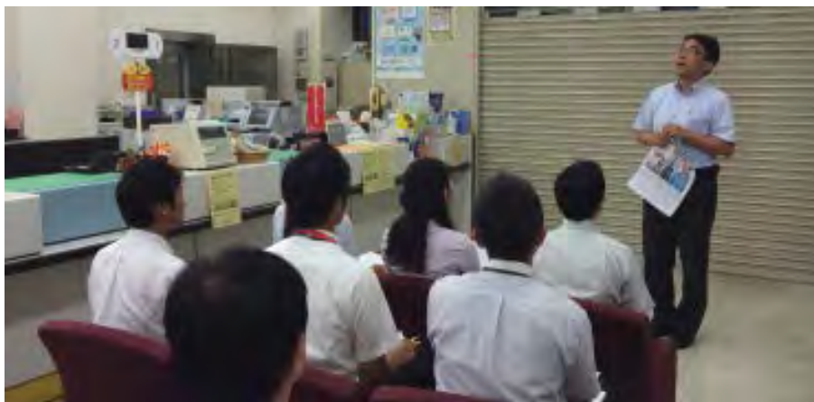
営業店との 情報共有