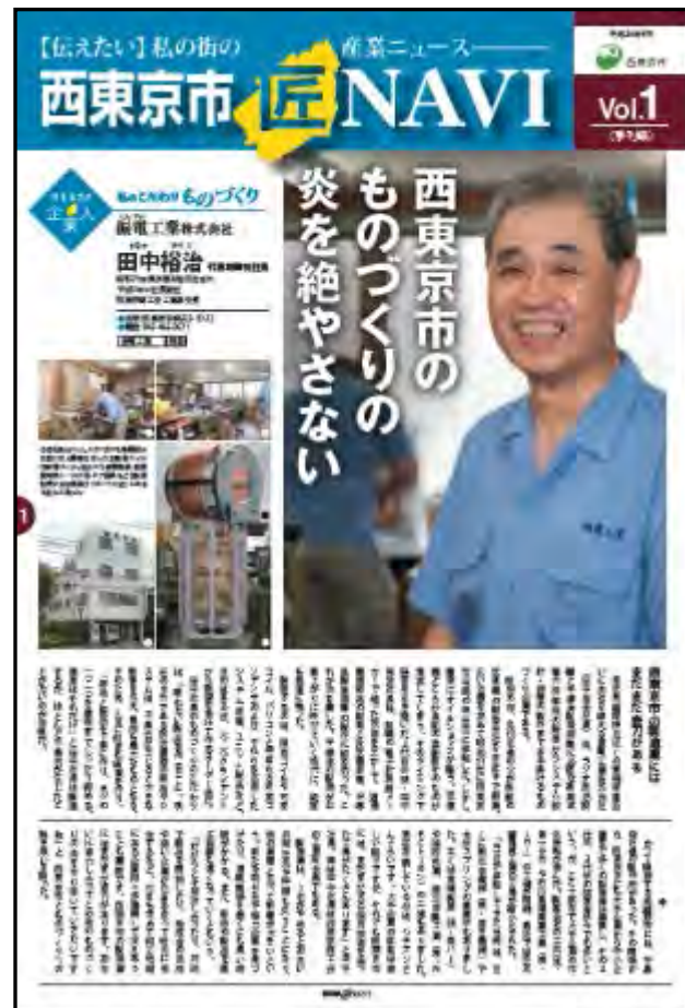
平成26年9月発行のVol.1（1面）