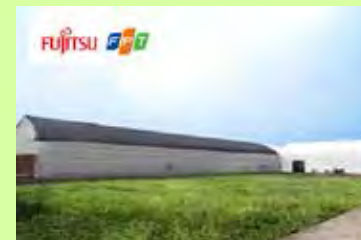
（図）富士通株式会社とFPT Corporation（本社：ベトナム ハノイ）の協業によりハノイに設立された、日本の最新ICT農業を紹介するAkisaiショールーム

- 富士通、NEC、日立、NTT等のグループに加え、ベンチャー企業も次々に参入 。