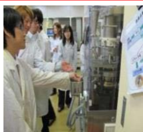
富山県薬事研究所