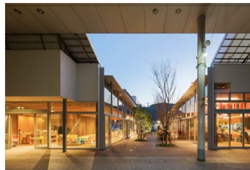
【油津商店街（宮崎県日南市）】

「250mのシャッター通りに、4年間で20以上の新規出店を実現すること」をKPIとし、マネージャーを外部公募。333人の中から選ばれた人物が中心となり、商店街を再生。