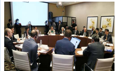
【総理のシリコンバレー訪問】