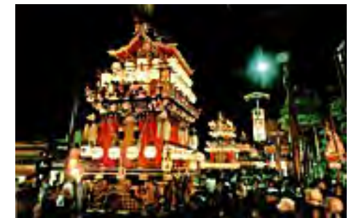
※写真は高山市観光課HPより引用