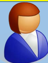
現役の国家公務員