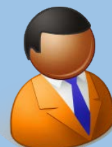
再就職した 国家公務員OB