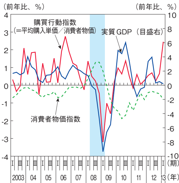
(1) 購買行動指数と実質GDP（推移）