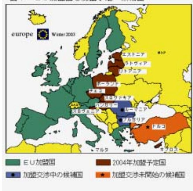
図 1 EU加盟国と加盟予定・候補国